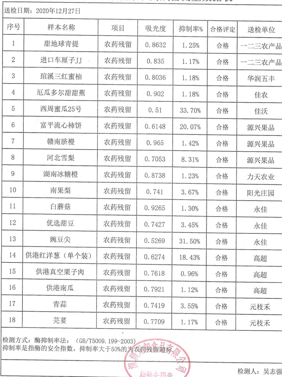
深圳元初水果蔬菜农药残留测量数据表